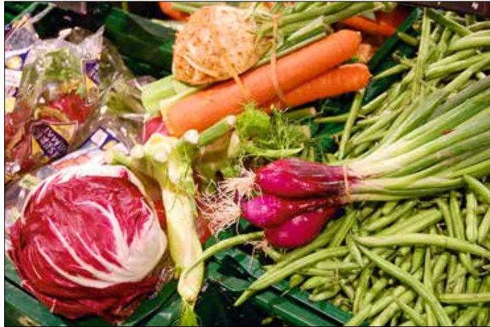
Gesundes soll verstärkt auf den Mensatisch.