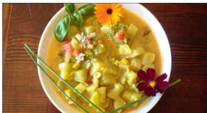
Angerichtet. Das Gurken-Kokosmilch-Curry.