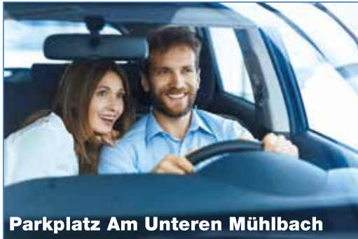
Parkplatz Am Unteren Mühlbach