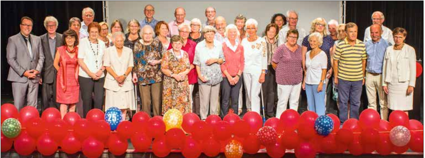
25 JAHRE SENIORENBÜRO