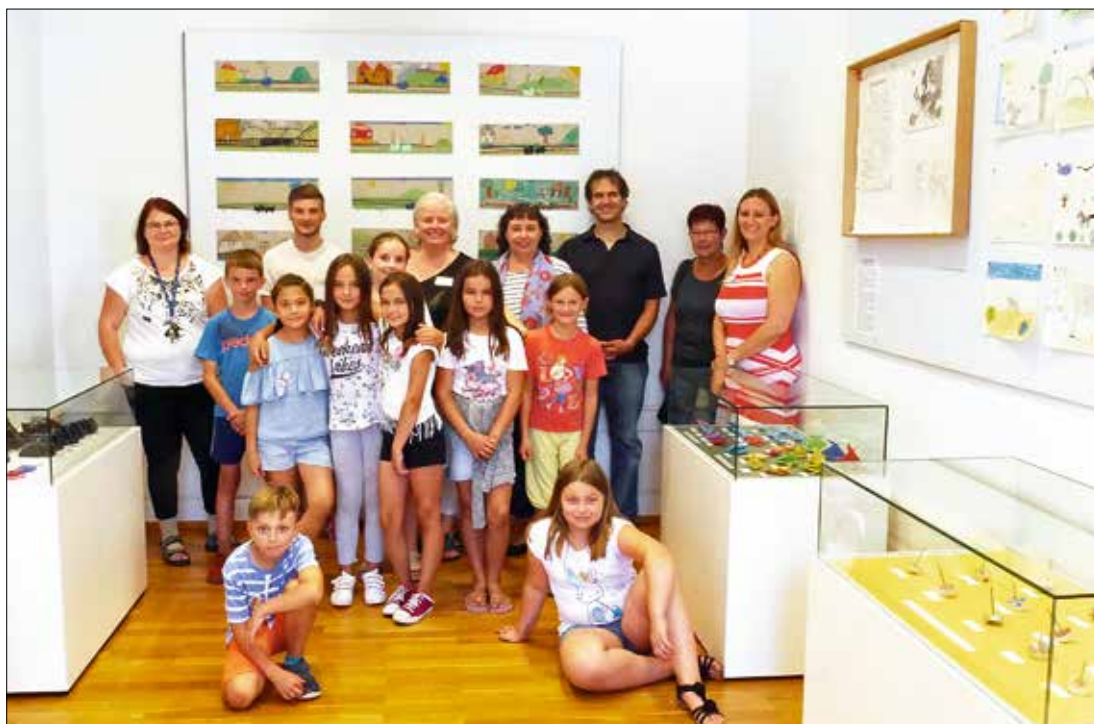
Schule im Museum. Fast ein halbes Jahr lang kamen Schülerinnen und Schüler der Eichendorff-Schule ins Museum im Ritterhaus, um vor Ort Ablauf und Inhalte kennenzulernen.

Wie entstand das Projekt? Im Anschluss an die Tagung Museum