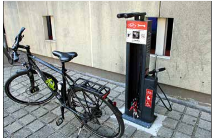
City-Parkhaus. Kleine Reparaturen rund um die Uhr möglich.

Ein Geschenk Baden-Württembergs an die Stadt