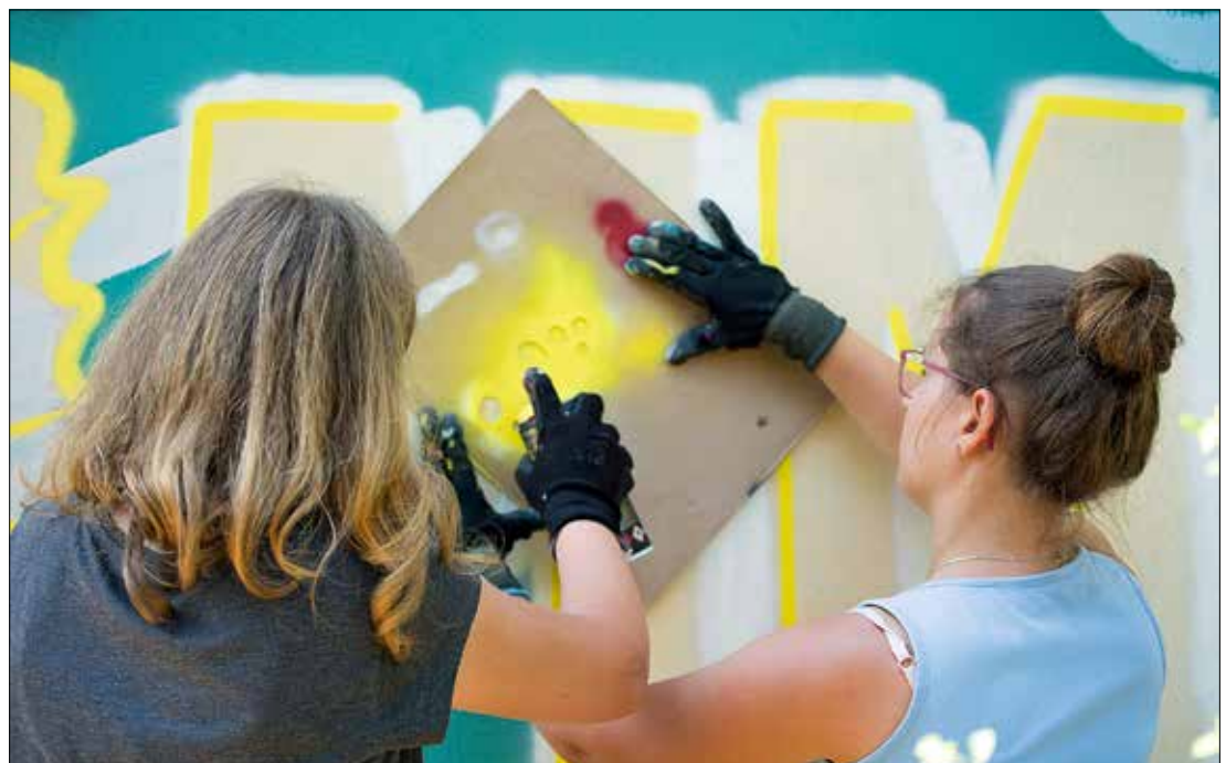
Begeistert beim Graffiti-Workshop. Der Umgang mit der Spraydose muss gelernt sein.