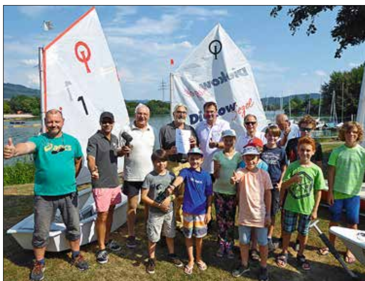
Daumen hoch. Bürgerstiftungsgeld lässt den OSCG jubeln.