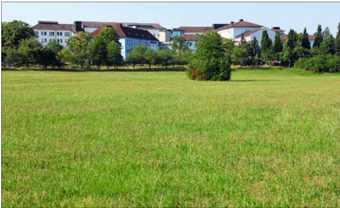
Josefsklinik. Auch dieser Standort wird voraussichtlich in 12 Jahren geschlossen.

Kreistag trifft Grundsatzentscheidung für Krankenhaus-Neustrukturierung ab 2030