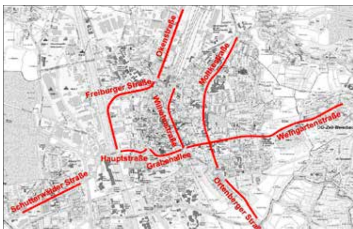
Mastrahmen-Pflicht. In den rot markierten Abschnitten. Grafik: Stadt

Staatsanzeiger für Baden-Württemberg GmbH, Breitscheidstraße 69, 70176 Stuttgart, Telefon: 07 11/66 601-555, Fax: 07 11/66 601-84, vergabeunterlagen@staatsanzeiger.de , www.vergabe24.de