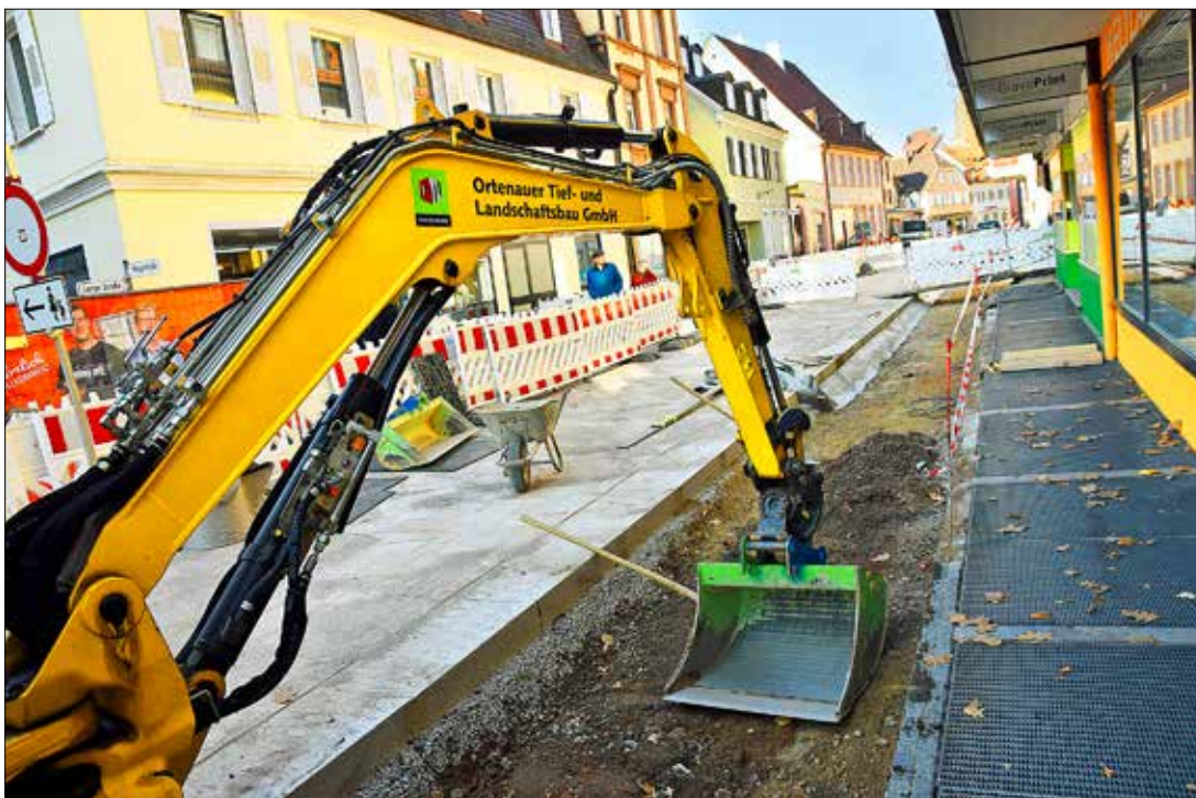
Lange Straße. Die Verbindung zwischen Lindenplatz und Rée Carré erhält derzeit ein neues Outfit.

Offenburger Gemeinderat vergibt für das Innenstadtprogramm GO OG gute Noten