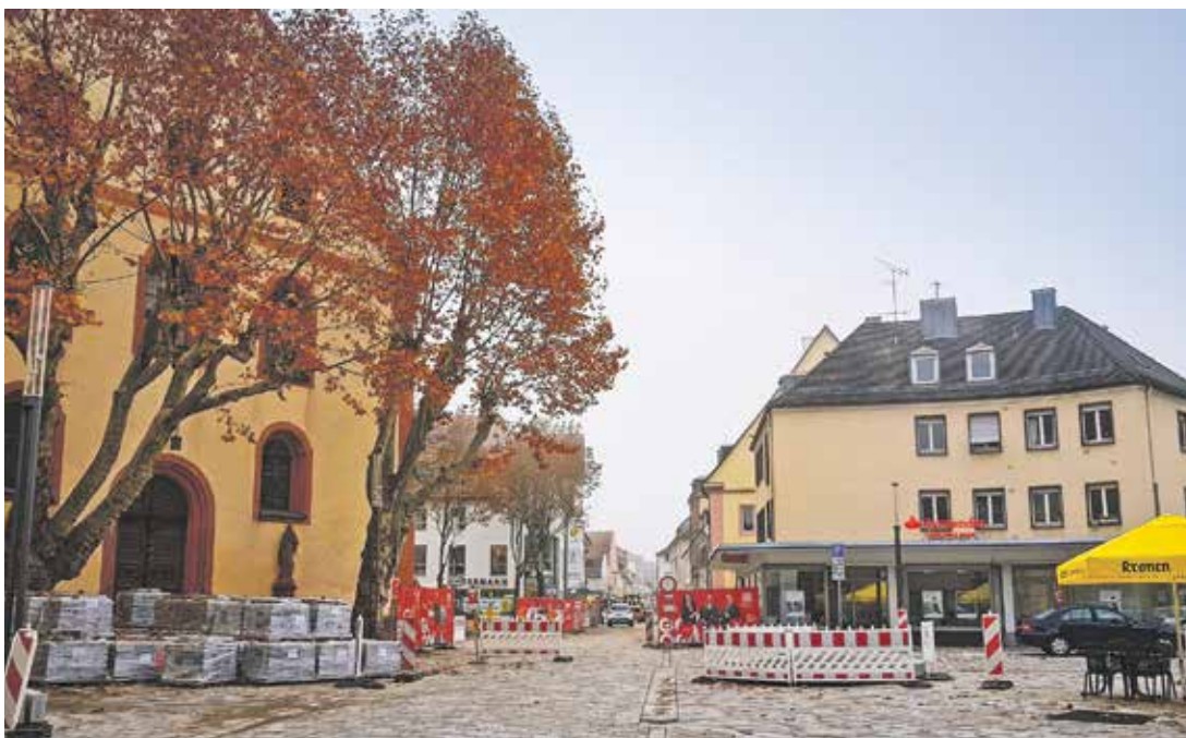
Herbstliche Stimmung am Klosterplatz: Trotz der Baustelleneinrichtung lässt sich die neue Aufenthaltsqualität in der Lange Straße bereits erkennen.

Im Sommer soll es dann ein großes Fest geben, um die Fertigstellung der zweiten Phase des Projekts „Neugestaltung Östliche Innenstadt“ gebührend zu feiern.