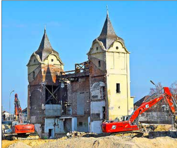
Steht stabil. Der Portikus der alten Stadthalle im Rée Carré.

Hege, demnach könnte eine zusätzliche Fläche von 16 400 Quadratmetern gebucht werden. Man sei mit vielen Interessenten in Verhandlung, allerdings sei „die Tinte noch nicht trocken“. 18 bis 20 Läden müssen noch belegt werden. Die Gesamtladenfläche liegt bei 12 000 Quadratmetern. Mit