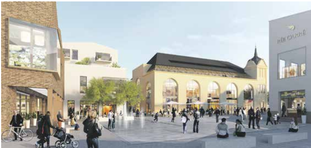
Bald Wirklichkeit: Auf dem Rée Carré-Areal entstehen insgesamt fünf Gebäude mit rund 30 Geschäftseinheiten und 22 Wohnungen. Visualisierung: OFB Projektentwicklung GmbH

Hochbauarbeiten sollen bald starten / OFB gibt weitere Mieter bekannt