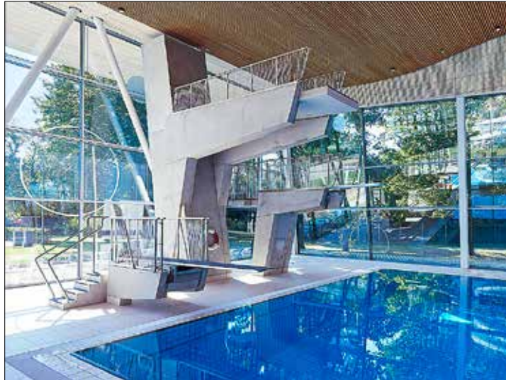
Vorzeigeprojekt. Das Freizeitbad Stegermatt kommt an.