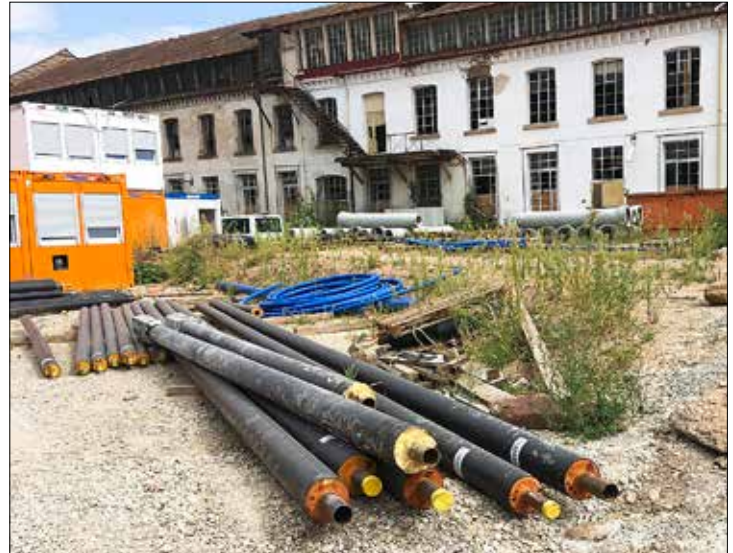
Das Nahwärmenetz im Mühlbachareal wurde gerade fertiggestellt.

Stadt und Wärmeversorgung treiben Wärmewende voran