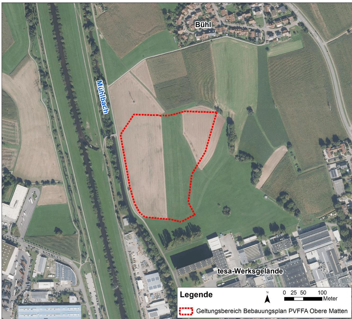
Abb. 1: Übersicht über den Geltungsbereich des Bebauungsplans Nr. 10 „PV-Freiflächenanlage Obere Matten“ auf der Gemarkung Bühl

Für die Herstellung der planungsrechtlichen Zulässigkeit der geplanten PV-Freiflächenanlage wird der Bebauungsplan Nr. 10 „Freiflächen-PV-Anlage Obere Matten“ aufgestellt.