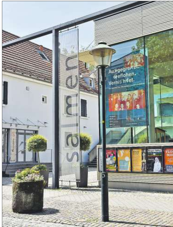
Salmen. Blick von der Lange Straße auf das Kulturdenkmal.

Carmen Lötsch ging auf die ein- zelnen Schritte ein, die bis zu den Heimattagen 2022 vollzogen werden sollen: Vorgesehen sind Barrierefreiheit für alle öffentlichen Räu- me, ein neu zu schaffender Erschließungstrakt im Zwischen- bau des Vorderhauses, um alle Ge- bäudeteile miteinander zu verbind- en, zusätzliche Räume für die Öffentlichkeit, um Platz für maxi- mal 45 000 Nutzer/innen pro Jahr