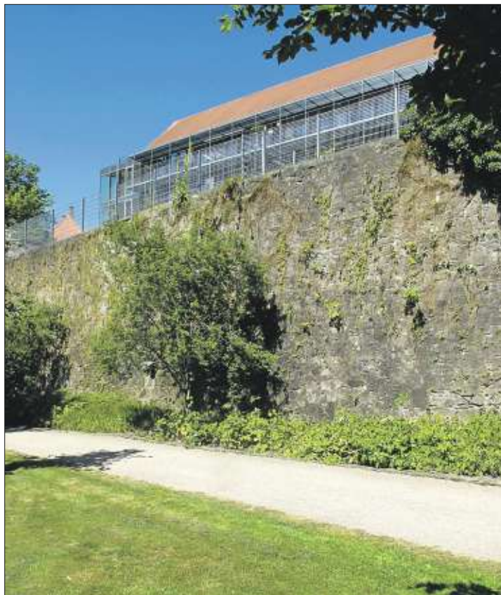
Südlich des Vinzentiusgartens. Hier soll der Aufzug hin.