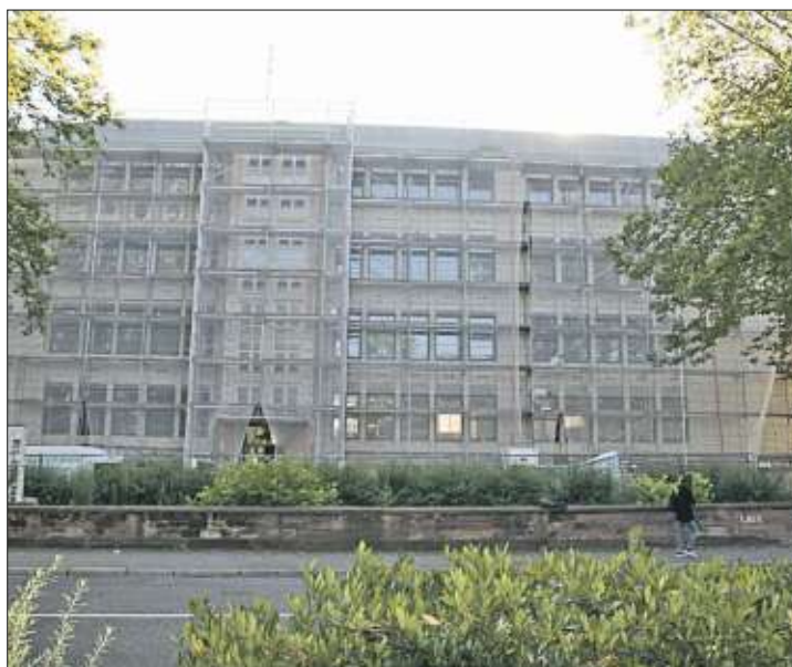
Eingerüstet. Das erweiterte Unterrichtsangebot an der Georg-Monsch zum Ganztagsbetrieb reduziert Nachfrage nach Hortbetreuung.

Michael Hattenbach stellte die Inhalte der neuen Angebote vor. Die Schulkinderbetreuung nach dem Unterricht kann jetzt nicht nur