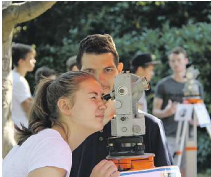
Vermessung. Früh übt sich.