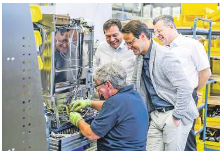
Werksbesichtigung. OB Marco Steffens (M.) macht sich vor Ort ein Bild.

Bereits seit dem Jahr 1960 produziert das Unternehmen seine Spülmaschinen in Offenburg und beschäftigt mittlerweile rund 1100 Mitarbeiter/innen in Deutschland. „Trotz des Fachkräftemangels sind wir auf Wachstumskurs und werden im Hinblick auf unsere 12 000 Quadratmeter große Werkserweiterung weitere Mitarbeiter einstellen“, berichtet Beck, der die vielfältigen Rahmenbedingungen bei Hobart, wie beispielsweise flexible Arbeitszeiten oder eine Erfolgsbeteiligung in