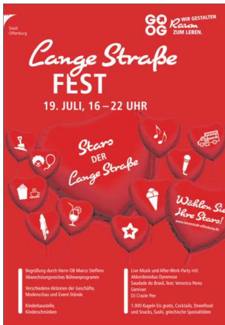
Rote Herzen soll es in der Lange Straßen regnen.

Kleine Innenstadtbesucher/innen können beim Kinderschminken in neue Rollen schlüpfen oder auf der Kinderbaustelle ihre Bud-