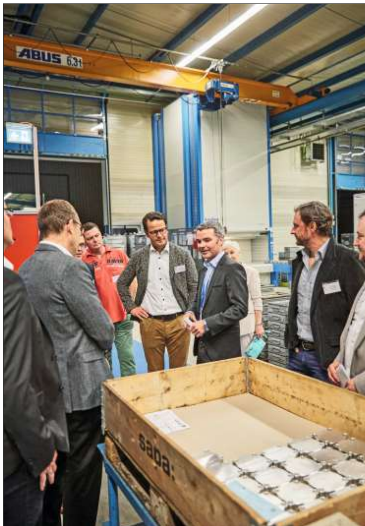
Rundgang. Viel Interesse an der breiten Produktpalette.