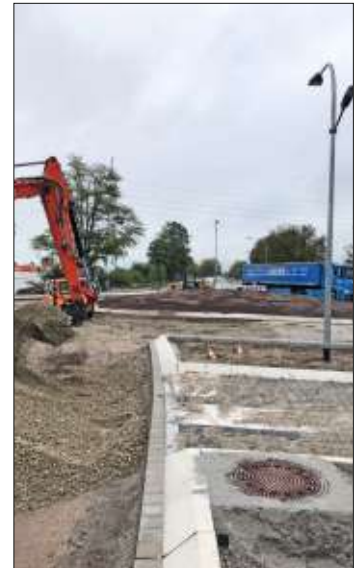
Umbau. Der Verkehrsfluss soll verbessert werden.

Die Vollsperrung der Otto-Hahn-Straße wird in zwei Abschnitten erfolgen. In der Zeit ab 2. November bis 1. Dezember 2019 wird die Otto-Hahn-Straße zwischen neuem Kreisverkehr