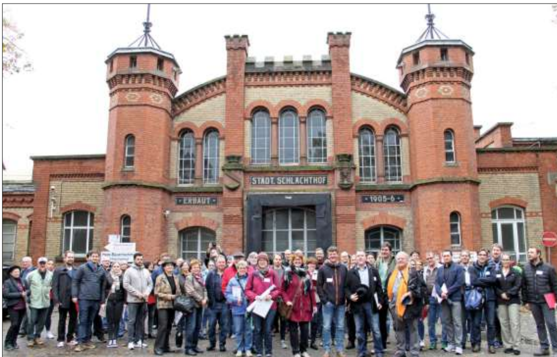
Großer Andrang. Die Führung übers Schlachthof-Gelände stieß auf großes Interesse.

Ideenwettbewerb für das Schlachthof-Gelände wird nächstes Jahr ausgelobt/Rundgang