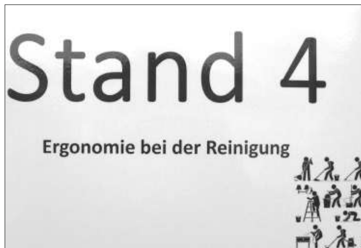
Hilfreich. Die Tipps der Experten werden im Alltag umgesetzt.