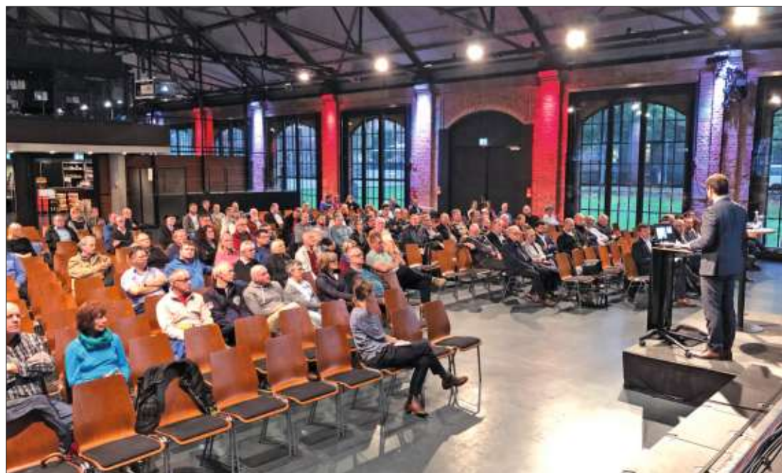
Reithalle. Über 100 Bürgerinnen und Bürger informierten sich über den Klinikneubau.

Zu Beginn steht der Grunderwerb am ausgewählten Standort an. Er soll im freihändigen Erwerb