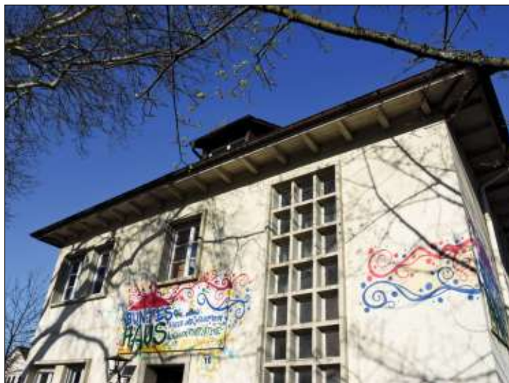
Erweitert werden soll das Bunte Haus in der Oststadt um eine kleine Kindertagesstätte.

Im Anschluss daran stellte er die geplanten Erweiterungen, Sanierungen sowie Um- als auch Anbauten in 2019 und 2020 vor. Umbau der Kindertagesstätte Stegermatt und des Bürgerhauses: Ausbau des Bürgerhauses zu einer 3-gruppigen Krippe, Anpassung der Toiletten und der Fluchtwege im Bürgerhaus an die gültigen Standards sowie Verlegung einer Krippengruppe in das Bürgerhaus und Schaffung einer neuen Kindergar-