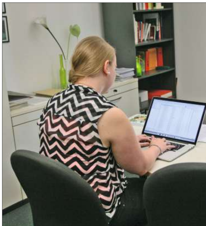
Digitalpakt Schulen. Die Stadt nutzt alle Fördertöpfe.

auf die einzelnen Kommunen aufgeteilt werden. Unter die Vorgaben von Bund und Land fallen die Antragstellung Digitalpakt Schulen (nur Bund) vom 1. Oktober 2019 bis 30. April 2022 (1. Tranche) bzw. 30.6.2024 (2. Tranche), ein schulspezifischer Medienentwicklungsplan (MEP) mit Ist-Bestand und Soll-Ausstattungsliste, technisch-pädagogischem Ein-