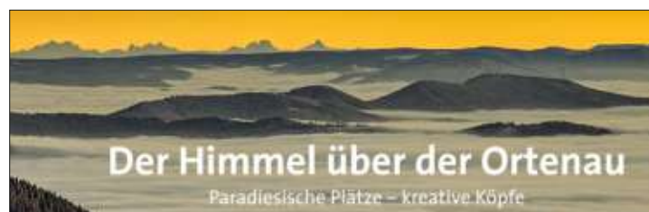
Schau. Großformatige Fotos werden gezeigt.