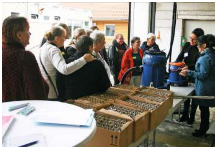
Informativ. Die Reinigungskräfte ließen sich an sechs Stationen schulen.