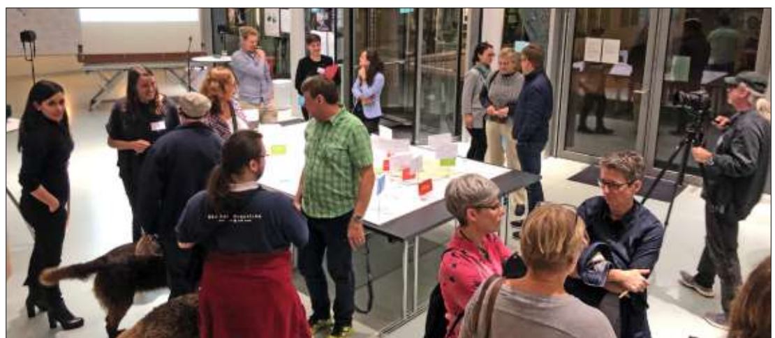
Reges Interesse. Die Anregungen sollen in den weiteren Prozess der LGS-Bewerbung einfließen.