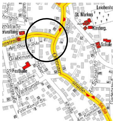
Abb. 3: Auszug Stadtplan Elgersweier Im Bereich des Linde-Areals mit Darstellung der öffentlichen Gebäude und Bushaltestellen

Das Rathaus, die Festhalle, das Gemeindehaus und die Kirche des Ortsteils Elgersweier befinden sich in fußläufiger Entfernung zum Linde-Areal.