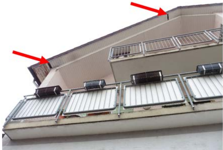
Abb. 4: Potenzielles Fledermausquartier am Gebäude Ortenaustraße 22 (linkes Bild) und potenzieller Haussperlingsbrutstandort und Fledermaushabitat am Gebäude Kreuzwegstraße 1b (rechtes Bild) - jeweils gekennzeichnet durch einen roten Pfeil