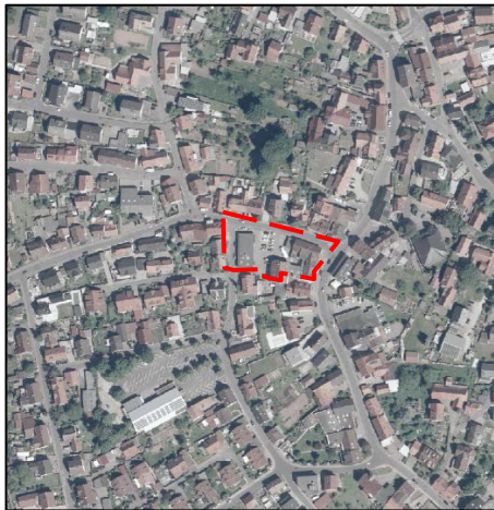
Abb. 2: Luftbild Ortsmitte Elgersweier mit Geltungsbereich Bebauungsplan Nr. 11 „Linde-Areal“