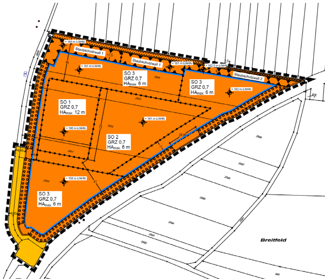
Abb. 3 Entwurf des Bebauungsplans zum Beschluss der erneuten Offenlage (2022) sowie zum Satzungsbeschluss und zur Rechtskraft (2023)

2015 hat die BAO eine neue Standortkonzeption für die geplante Anlage vorgelegt, die eine Kompaktierung des Flächenlayouts vorsah. Statt des aufgrund der Flächenverfügbarkeit bedingten Sporns in die Obstbauflächen nach Norden wird das Plangebiet dreieckig nach Süden ausgeformt. Gleichzeitig ist, in Anpassung an die Gutachten zu Staubschutz und Kleinklima, ausschließlich eine zwei bis vier Meter hohe Wallanlage am Nordrand des Plangebiets festgesetzt, bei Erforderlichkeit und Verträglichkeit mit anderen planungsimmanenten Belangen können Wälle jedoch auch an anderer Stelle additiv genehmigt werden. Das Sondergebiet wurde in drei verschiedene Nutzungszonen gegliedert, wobei ausschließlich im Teilbereich 1 nun – entgegen dem Sachstand zur Offenlage des Bebauungsplans 2010 – die Errichtung von Betriebshallen in begrenztem Umfang zulässig ist.